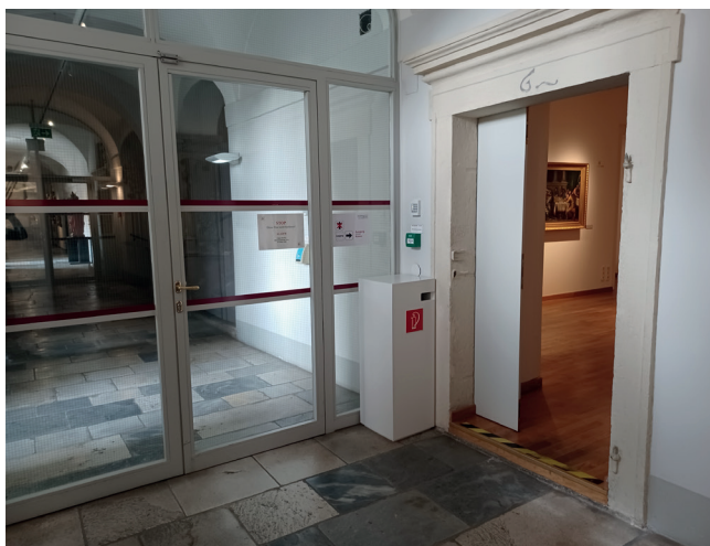
Zugang Dauerausstellung mit 9 cm Schwelle