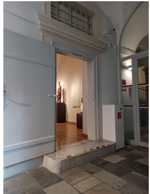
Zugang Dauerausstellung mit Stufe

In den Ausstellungen selbst ist ausreichend Platz.