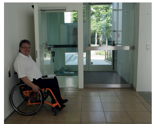
Seiteneingang und Zugang Hebebühne