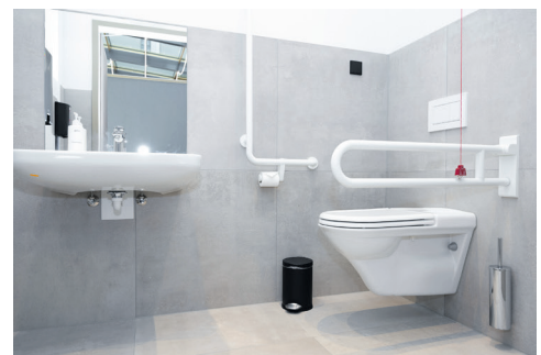
Allgemeines barrierefreies WC