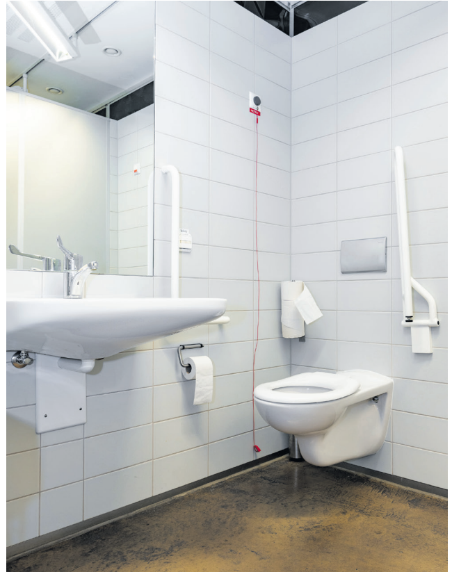
Barrierefreies Herren-WC (ohne Beschreibung)