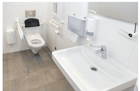
Barrierefreies WC Detroit-Halle