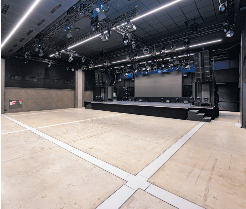
Veranstaltungsraum Detroit Halle