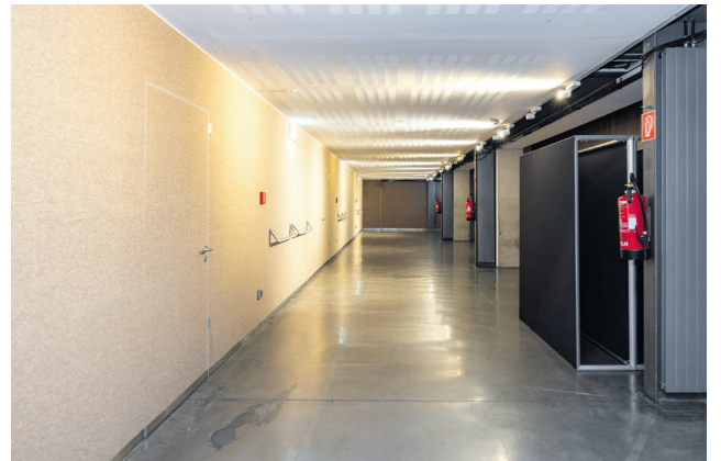
Weg zu den vorderen Plätzen