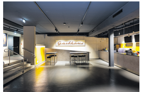
Bar und Rampe Detroit Halle