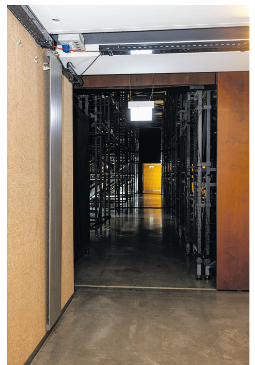
Weg zu den vorderen Plätzen