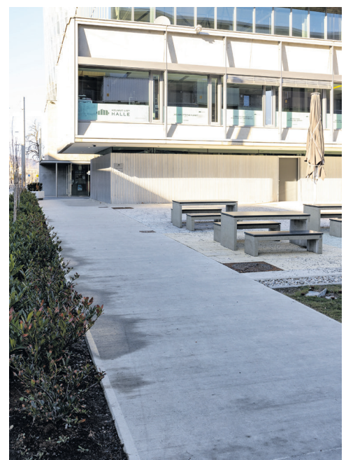
Barrierefreier Zugang vom Parkplatz