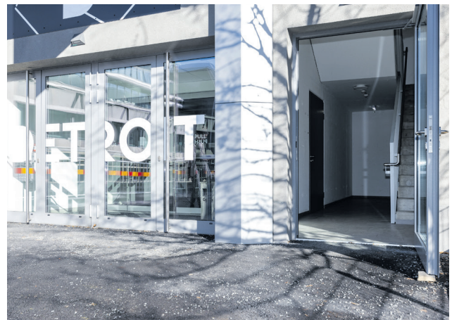
Haupteingang und barrierefreier Eingang Detroit-Halle