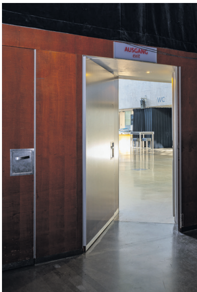
Zugang zur Halle