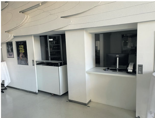
Bar (links) und Abendkassa (rechts)