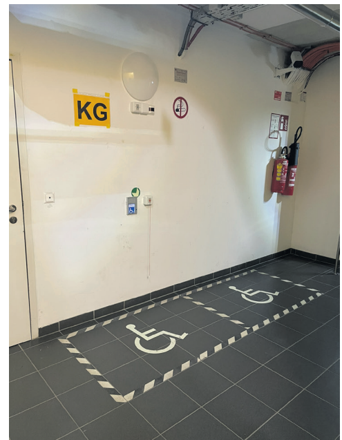
Verweilplätze für Rollstuhlfahrer