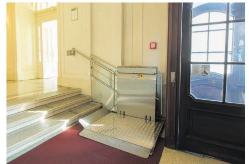
Stufen und Treppenlift