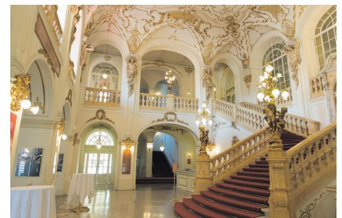
Foyer mit Hauptstiege